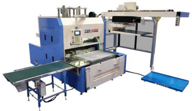
Sopra: Separatore di pezzi grezzi TXR-1100 per fogli formato B1 con mettifoglio, sollevatore di pallet e nastro trasportatore